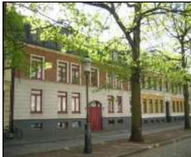
Fasaden ut mot Mjölnergatan

Den moderna arkitekturen i Öرنen har hämtat sin inspiration från postmodernismen, som hade sin storhetstid på 1990-talet. En stor inspirationskälla för denna stil var Charles Moore med sin Piazza d'Italia i New Orleans. Typiskt för postmodernismen var att blanda olika tidstypiska drag och förena dem i en och samma byggnad. Man blandade olika material, vinklar,