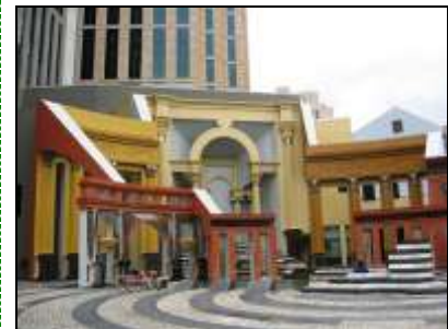
Piazza D'Italia i New Orleans – en inspiration till vår egen bostadsmiljö! Fast vår postmodernistiska byggnad är något mer behärskad!

Vår förening har således en byggnadsteknisk linje från det sena 1880-talets nyrenässansfasader till det sena 1990-talets mer lekfulla postmodernistiska experiment!